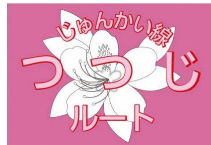
各ルート名の路線名称表示

東京ベイシティ交通では、浦安にお住まいの方々の生活の足として、今後もサービスの向上に努めて参ります。