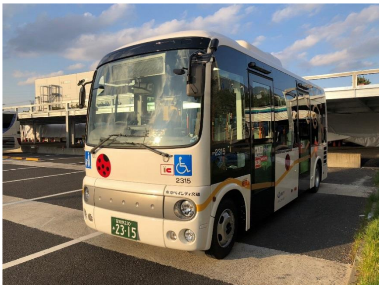
じゅんかい線を走るおさんぽバス車両

ルートは左右両回りを設定し、右回りを「浦安市の木：いちょう」から名付けて「いちょうルート（黄色）」とし、左回りを「浦安市の花：つつじ」から名付けて「つつじルート（ピンク色）」として運行します。