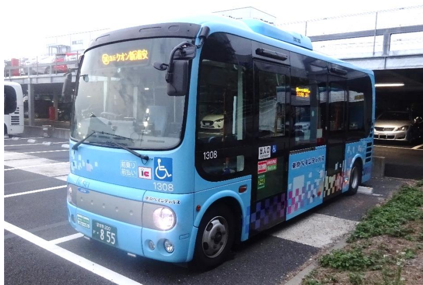
新設路線 38系統「クオン新浦安」行の路線バス