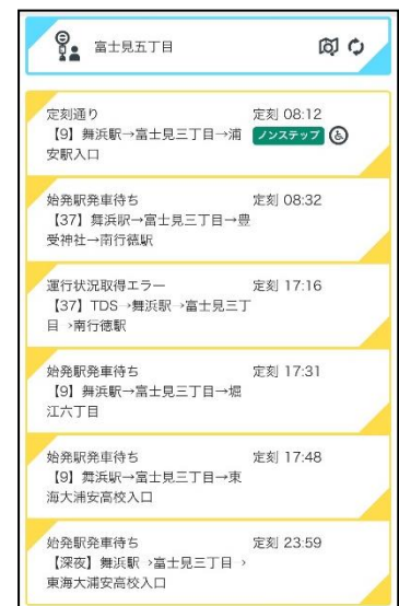
最寄停留所のバス一覧表