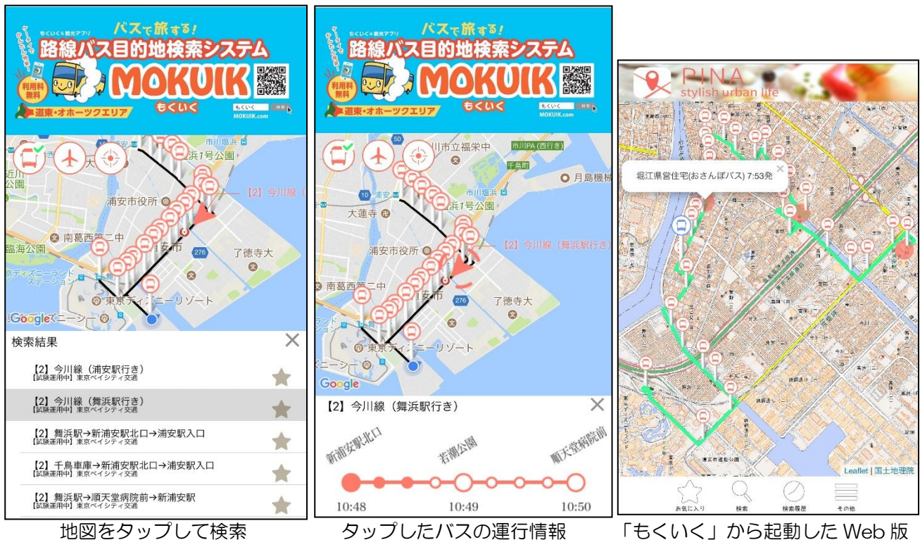
地図をタップして検索